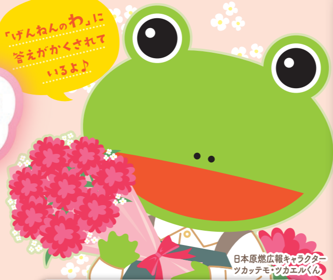
日本原燃広報キャラクター ツカテモツカエルくん